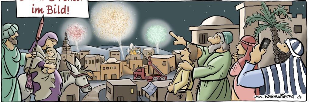
Rakete, Kirchturm, Feuerwerk, Feuerwehr, Handy