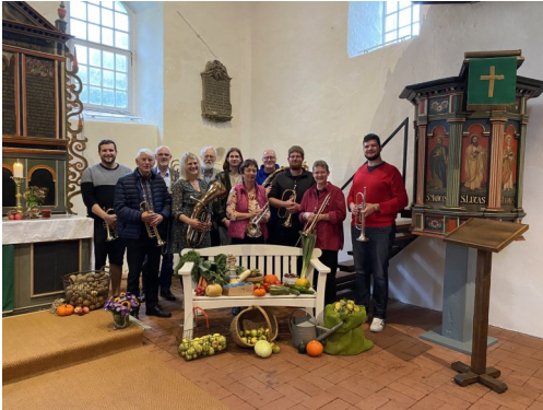
Erntegaben mit dem Posaunenchor in Asel

Am 1. Oktober fand, wie fast überall, das Erntedankfest in der Aseler Kirche statt.