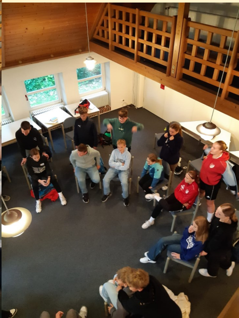
Spiele in der Konfigruppe am Unterrichtsende und Gottesdienst mit dem Kindergarten (unten links)